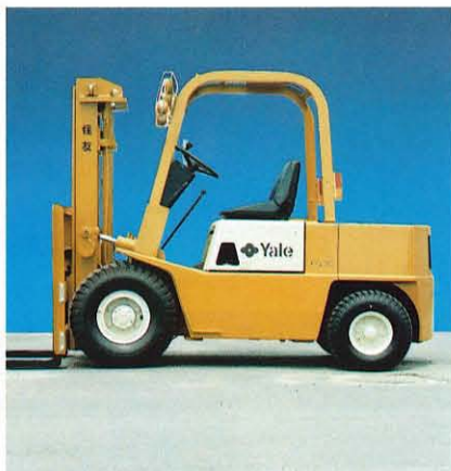
低重心で安定した車体