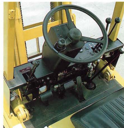
グンと広がった運転席足元