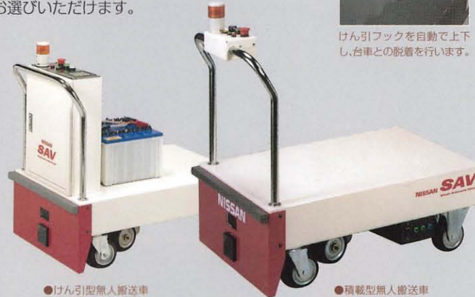
●けん引型無人搬送車 (行先指定あり)

けん引型、積載型に、低床けん引型が加わり、ますます充実した簡易無人搬送車SAVシリーズ。搬送重量は100kgから1,500kgまでのラインナップをご用意。目的に応じて、お選びいただけます。