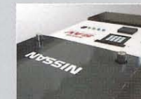
けん引フックを自動で上下し、台車との脱着を行います。

※バッテリーカバー、ウインカー、バンパー停止、メロディユニット、連結用アタッチメントはオプション。