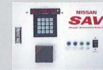
テンキーを標準採用、プログラムの設定・変更も簡単。