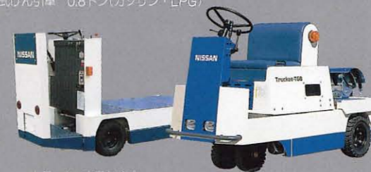
トラッキー立席タイプ (バッテリー)