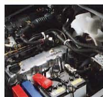
K15 (1.0~2.5トン車) 排気量: 1,486cc