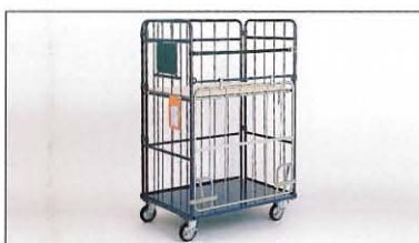
ロールボックスパレット