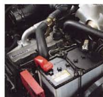
S4L (1.0~1.75トン系2.0トン車) 排気量: 1,500cc