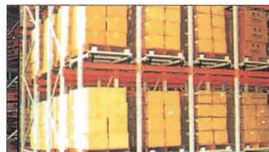
斜傾式流動ラック