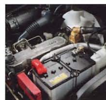
S4Q2 (1.0~1.75トン系2.0トン車) 排気量: 2,505cc