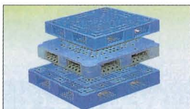
プラスチックパレット