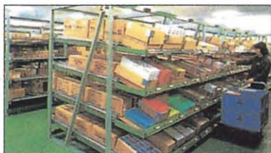
ピッキングラック