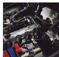
K25 (2.0~3.5トン車) 排気量: 2,488cc