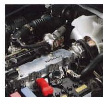
K21 (1.5~2.5トン車) 排気量: 2,065cc