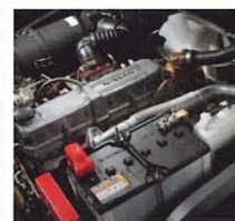
S4S (2.0~3.5トン車) 排気量: 3,331cc