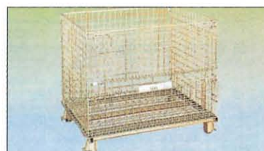
メッシュボックスパレット