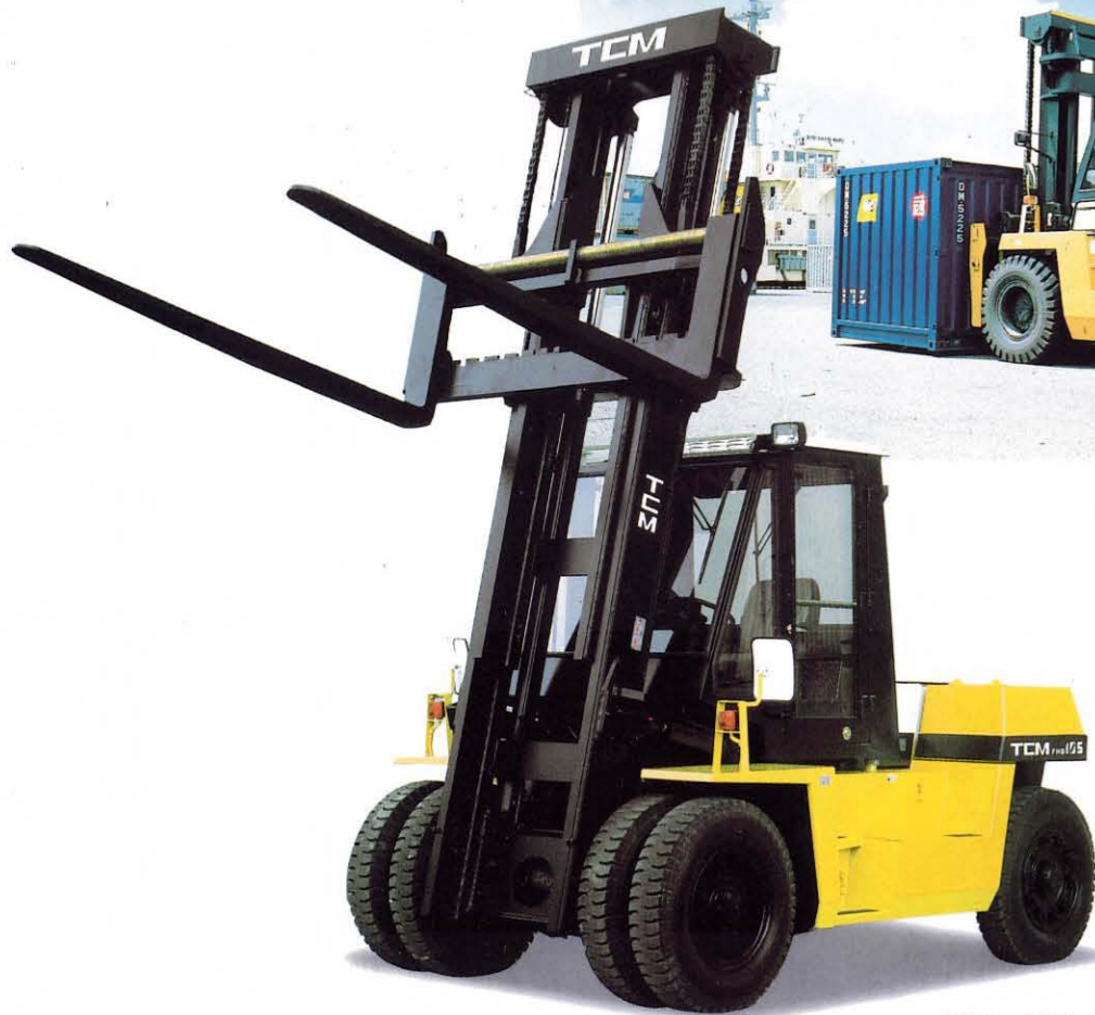
●長フォーク、スチールキャブはオプション。