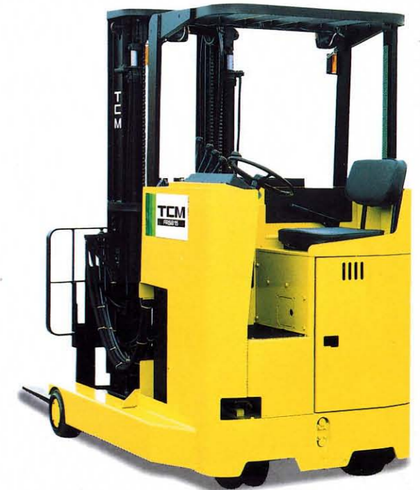
冷凍冷蔵庫仕様車、防爆仕様車もあります。