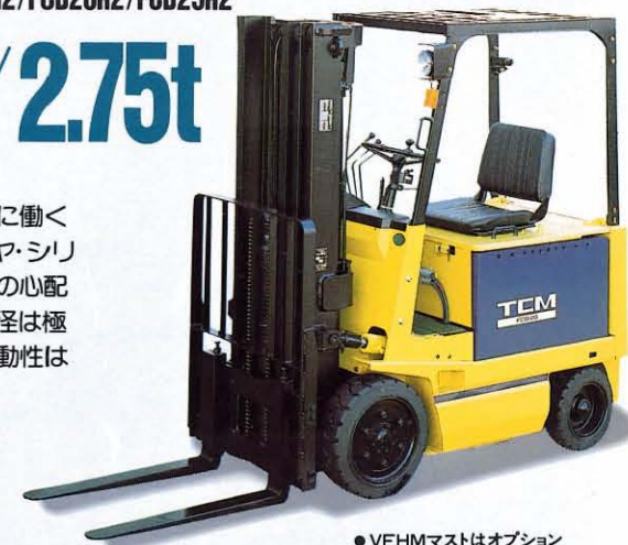
●VFHMマストはオプション

狭い場所でも機敏に働くクッションタイヤ・シリーズは、バンクの心配もなく、旋回半径は極めて小さく、機動性は抜群です。