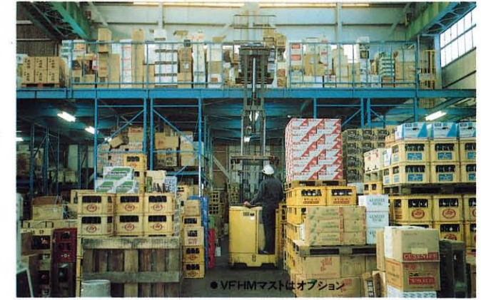
●VFHMマストはオプション

小回り抜群、積付性能に優れたTCMクリーンリーチは、狭い倉庫内で高能率を発揮する働き者です。スムーズでワイドクリーンな発進を行う、独自のG-TRによる無接点コントローラを初め、キックバック防止装置、電気式パワーステアリングなど、水準を超えたメカニズムが作業効率をグンとアップします。FRB/FRHBシリーズを初め、天井の低い所に適したFRBLシリーズ、長時間作業も快適居住の座席タイプFRSBシリーズと、用途に応じてお選びいただけます。