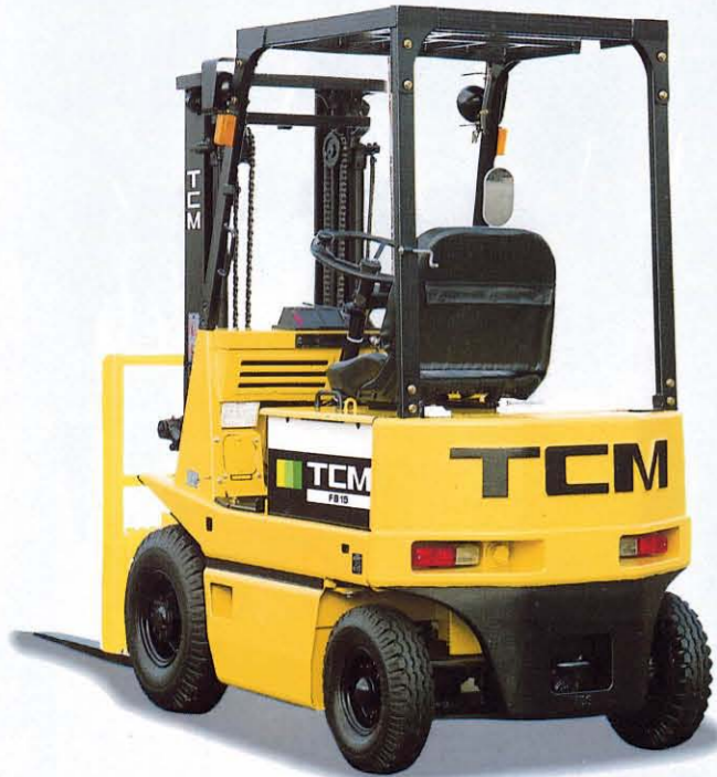
・スタンダードタイプ