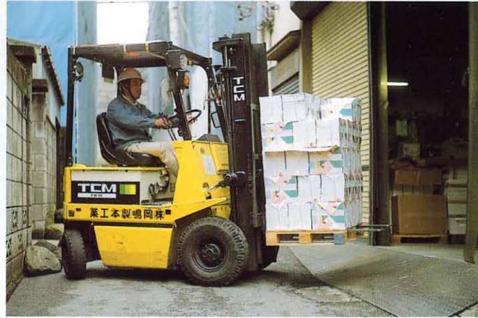
・ハイパワータイプ