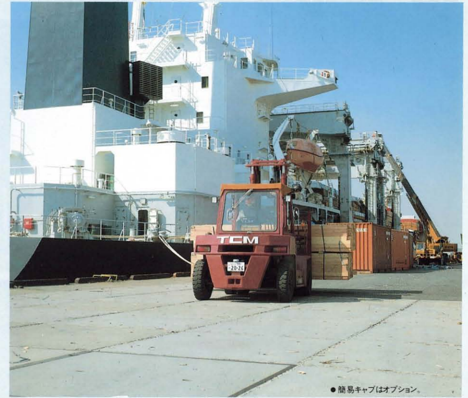
●簡易キャブはオプション。