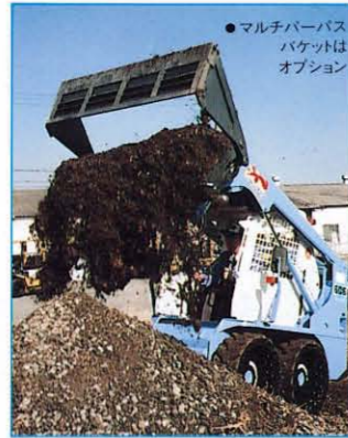
●マルチパーパス バケットは オプション