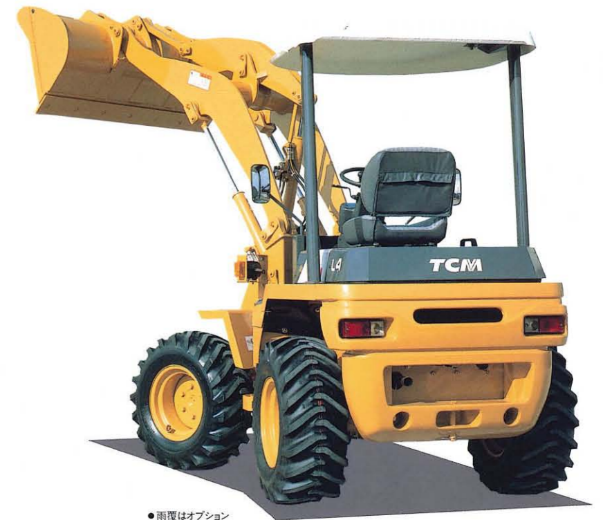
● 雨覆はオプション