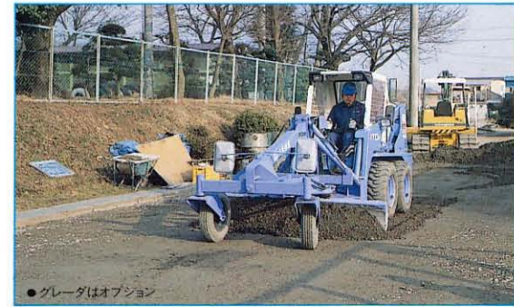
●グレーダはオプション

●ダートバケットをはじめ各種バケット、グレ ーダ、パレットフォーク、アースオーガ、土工 用ブレードなど、土木、管工事、建材業種 の多様な現場を、豊富なアタッチメントが幅 広くフォローします。