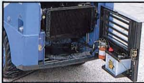
▲ワンタッチ開閉テールゲートボンネット、バッテリーHSTフィルタのテールゲートマウント