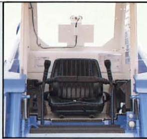
◀快適なコック ピット 操作の容易な シートバー