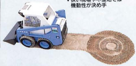
▼狭い現場や不整地では 機動性が決め手