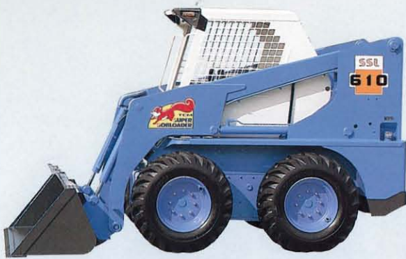
▲乗降性、視界の良いバケット2本シリンダ 車両安定性抜群のロングホイールベース