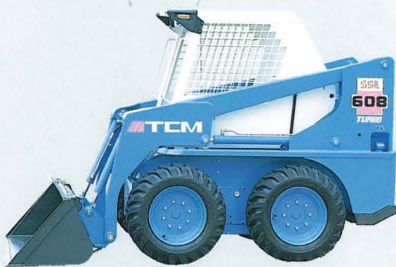
▲乗降性、視界の良いバケット2本シリンダ車両安定性抜群のロングホイールベース