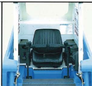
◀快適なコックピット 操作の容易なシートバー