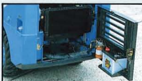
▲ワンタッチ開閉テールゲートボンネット、バッテリーHSTフィルタのテールゲートマウント