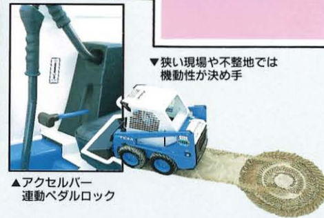
▲アクセルバー連動ペダルロック