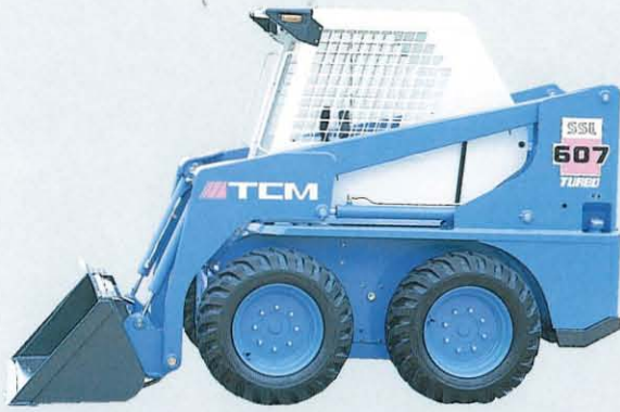
▲乗降性、視界の良いバケット2本シリンダ車両安定性抜群のロングホイールベース