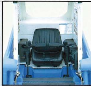
◀快適なコックピット 操作の容易なシートバー