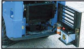
▲ワンタッチ開閉テールゲートボンネット、バッテリーHSTフィルタのテールゲートマウント