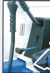
▲アクセルレバー連動ペダルロック