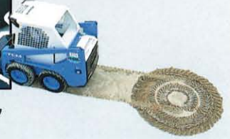
▼狭い現場や不整地では機動性が決め手