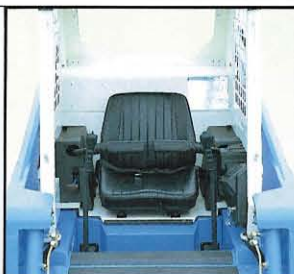
◀快適なコックピット 操作の容易なシートバー