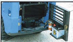
▲ワンタッチ開閉テールゲートボンネット、バッテリーHSTフィルタのテールゲートマウント