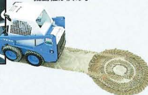
▼狭い現場や不整地では機動性が決め手