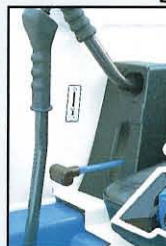
▲アクセルレバー連動ペダルロック