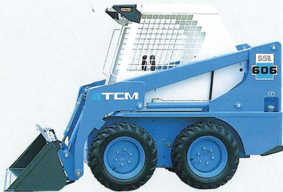
▲乗降性、視界の良いバケット2本シリンダ車両安定性抜群のロングホイールベース