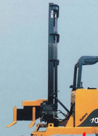
スロウ・スタッキングフォーク