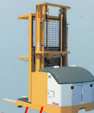
ヒックアップフォーク