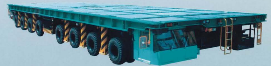
走行台車 P10 / P20 / P40 / P60 / P80 / P100 / P130 / P150 / P200 / P250 / P300 / P350 / P600 / P700 / P750