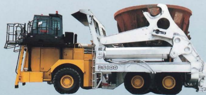
スラグダンプ DS15 / DS25 / DS35 / DS45 / DS50 / DS100