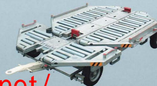
コンテナドーリー