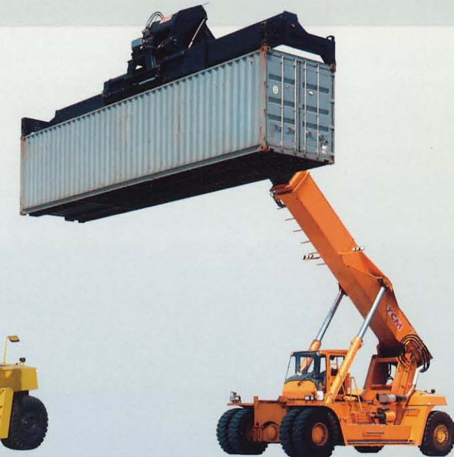
リーチスタッカー MR420