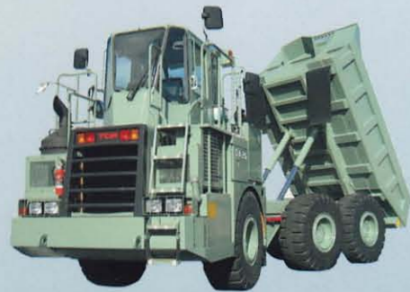
アーティキュレートダンプ DA26 / DV26