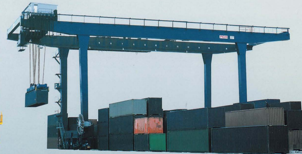
トランスファークレーン(レール式) RMG