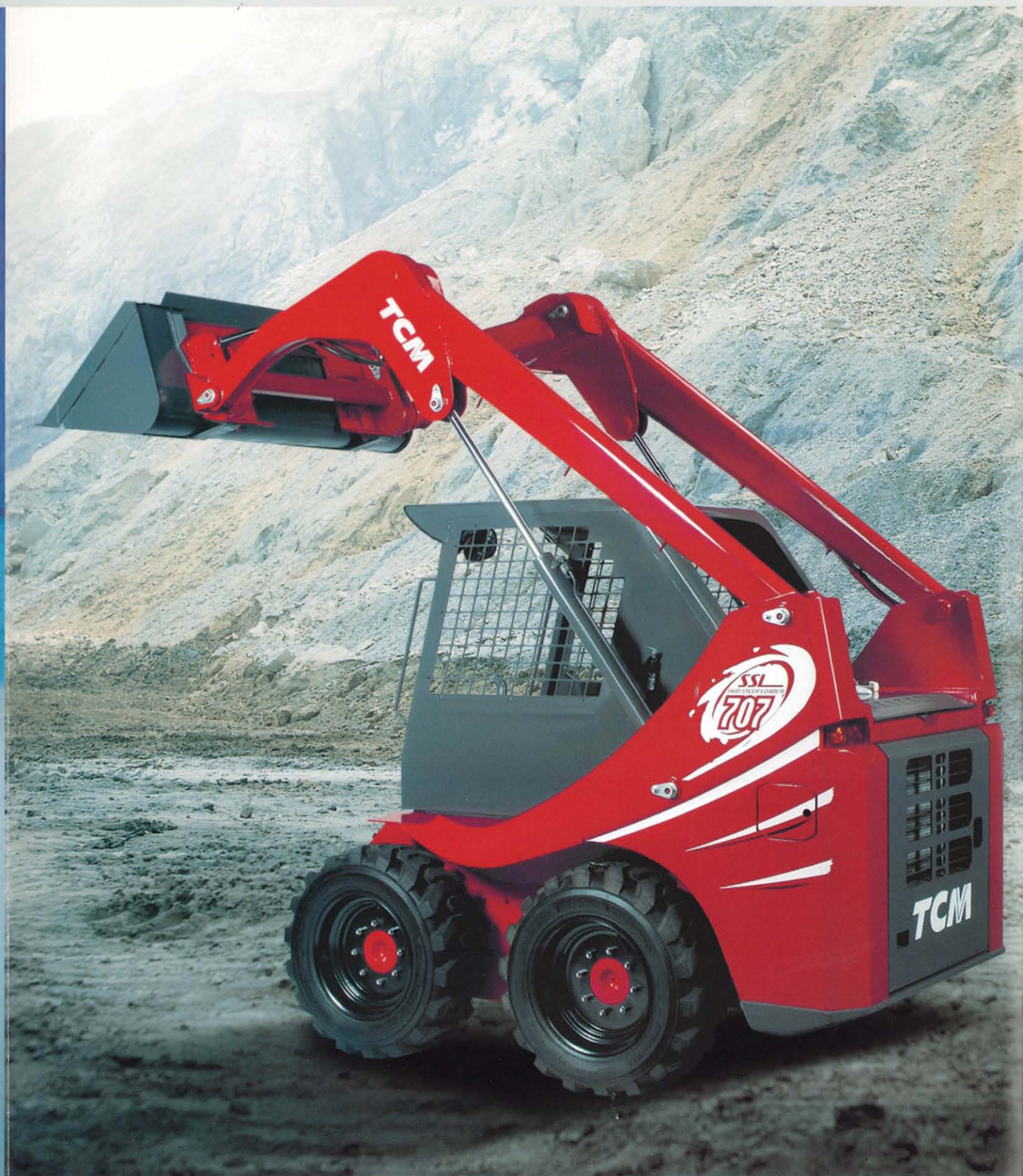
SKID STEER LOADER スキッドステアローダ