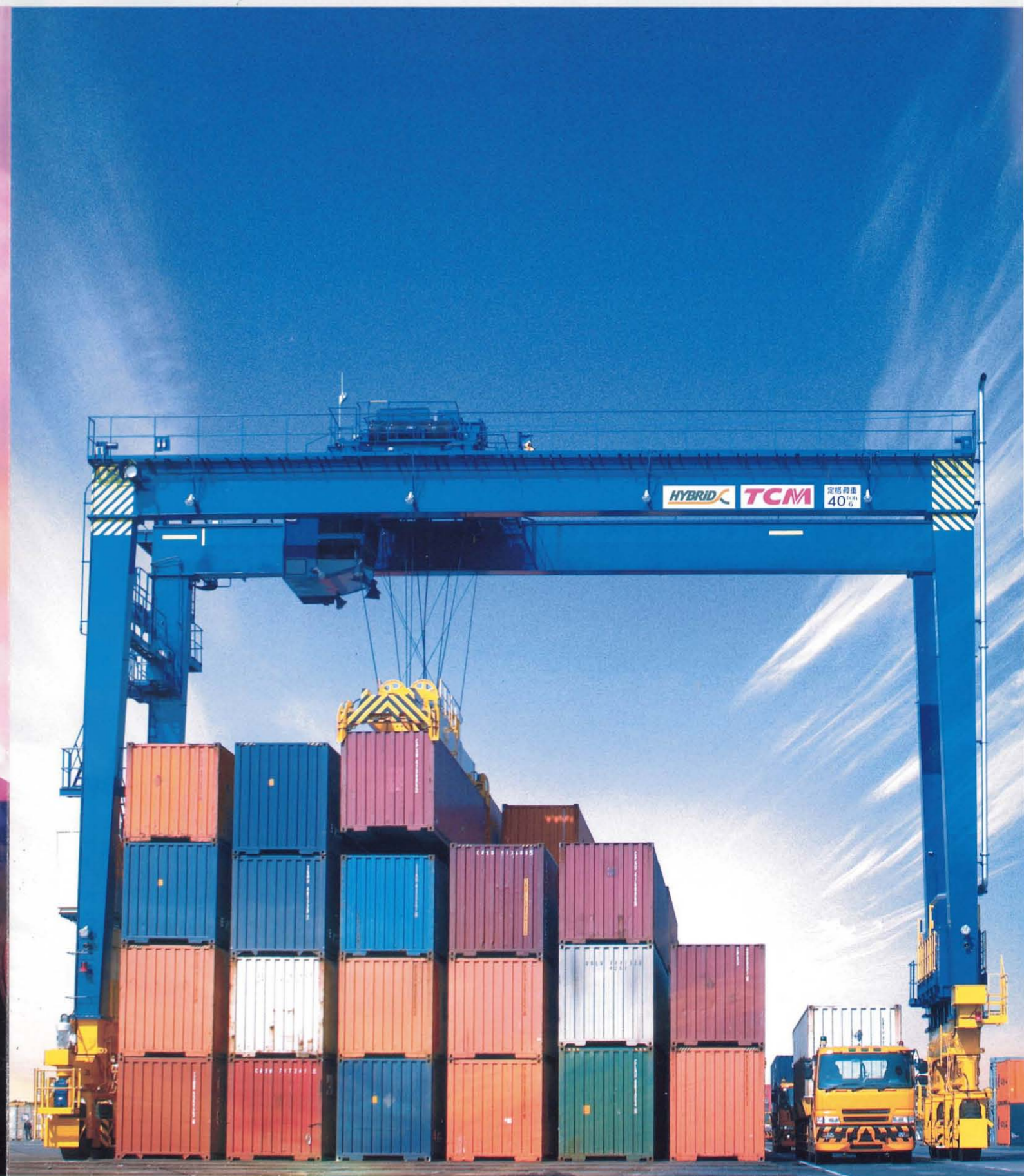
http://www.keiyou.net/ TRANSFER CRANE トランスファークレーン