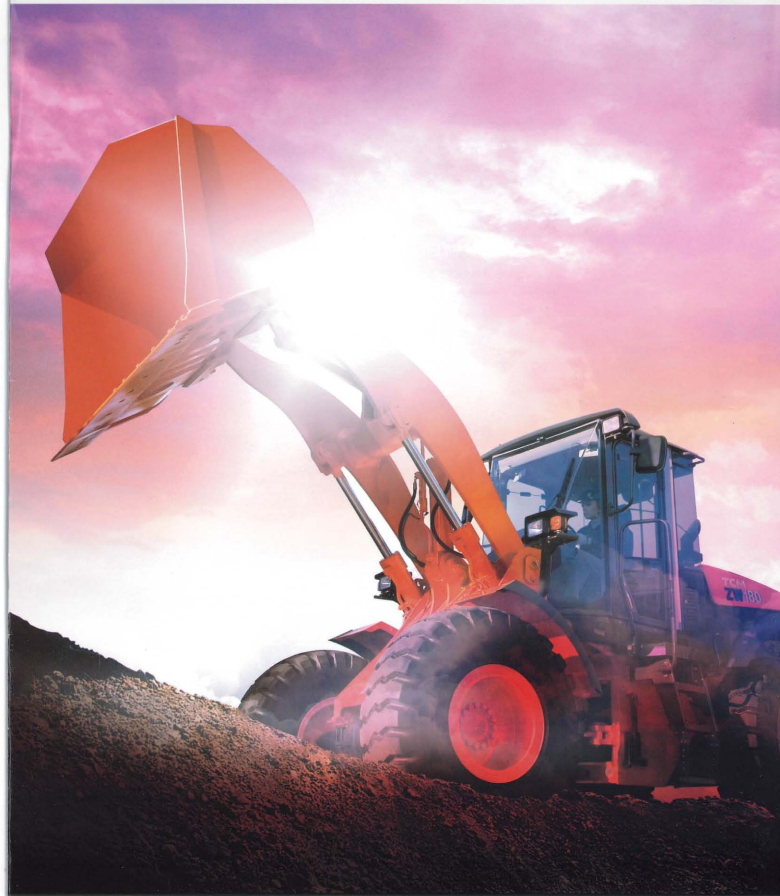
WHEEL LOADER ホイールローダ