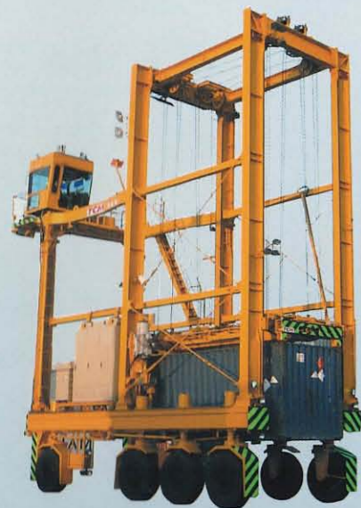
コンテナキャリア S3 / S4 / S4W