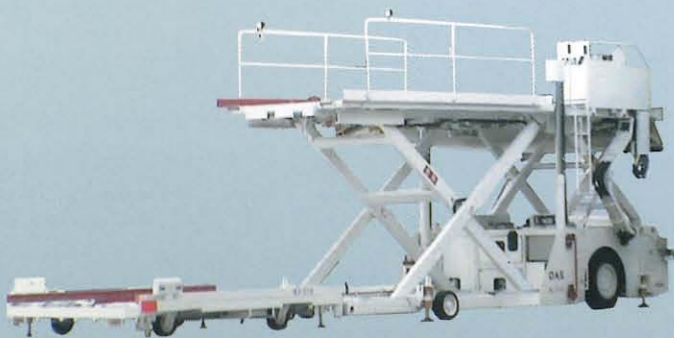
ハイリフトローダ