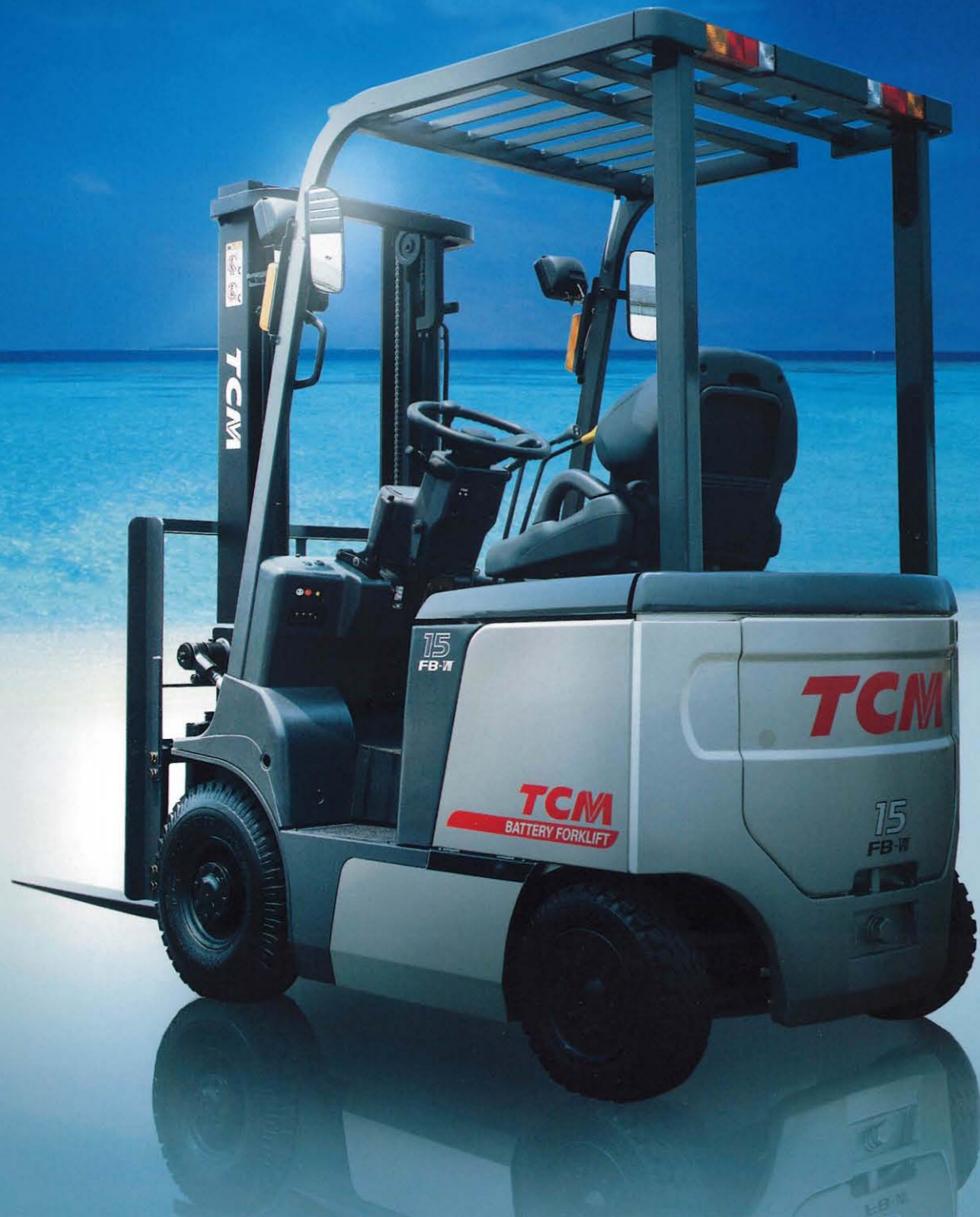
FORKLIFT TRUCK フォークリフト