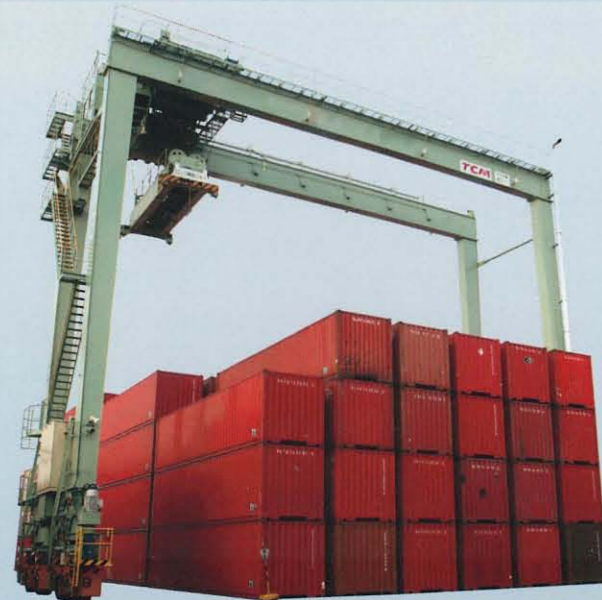
トランスファークレーン(タイヤ式) CT4 / CT5