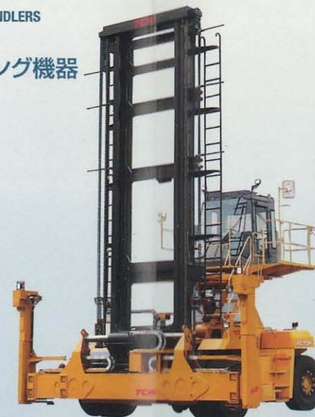
空コンテナ専用フォークリフト FC70H