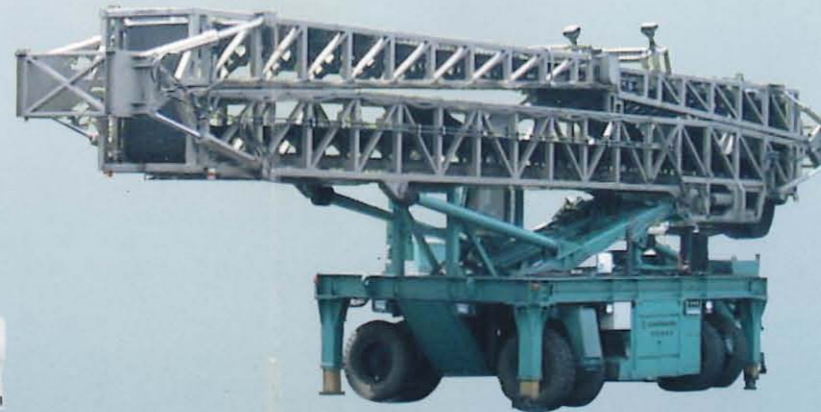
自走式ベルトコンベア TB2 / TB3 / TB3S / TB5 / TB5S