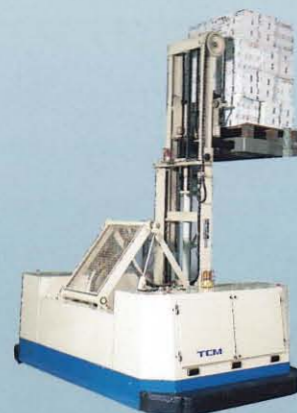
無人サイドフォークリフト