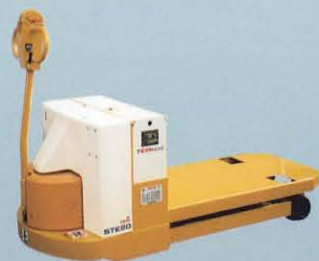
パレットトラック