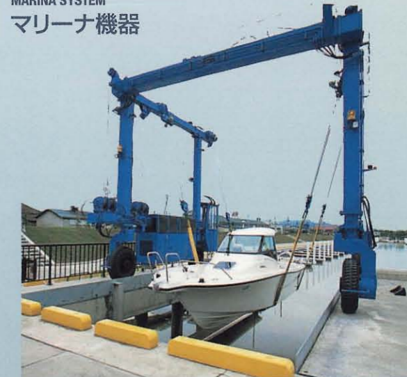
マリーナキャリア MC15/MC50