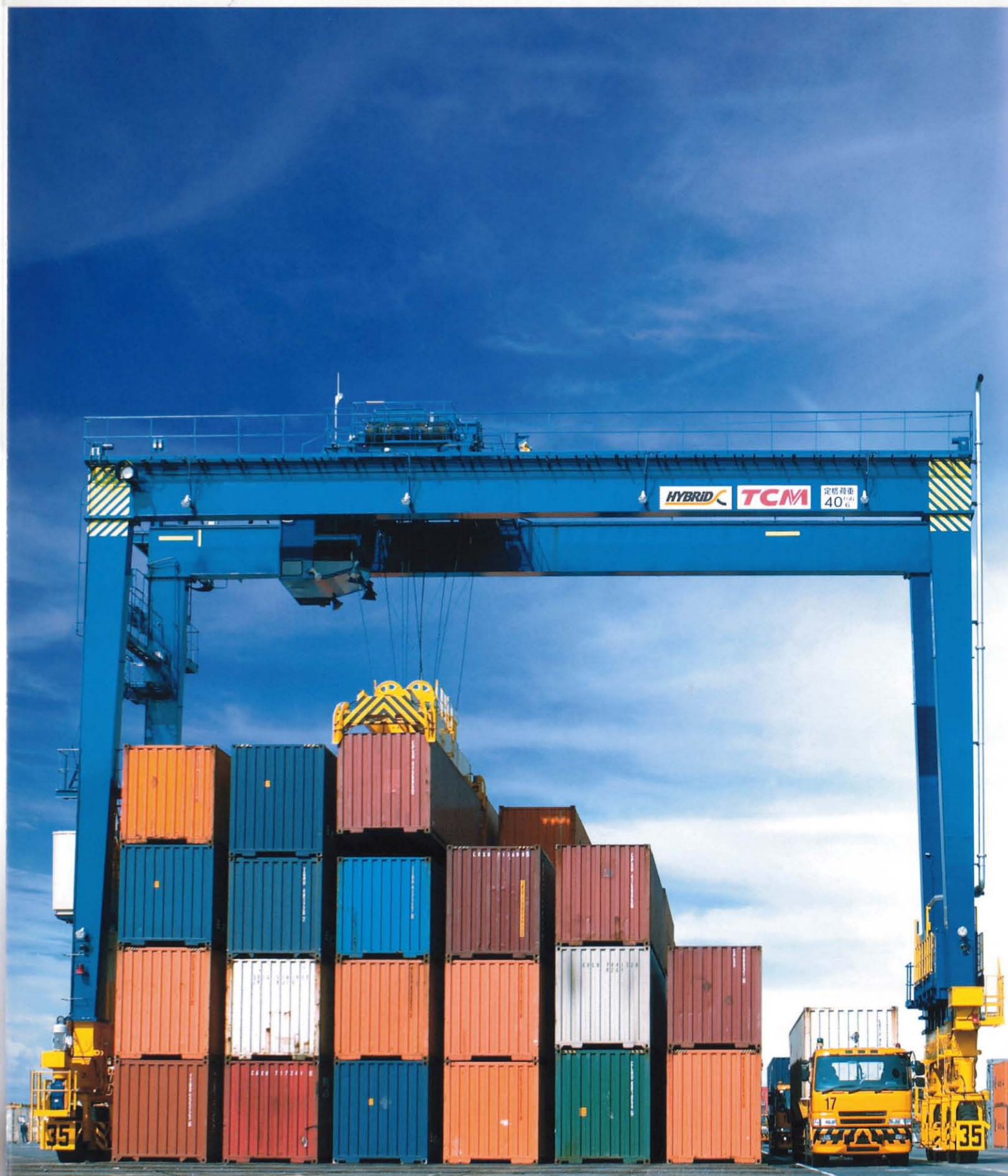
TRANSPORTER トランスファークレーン