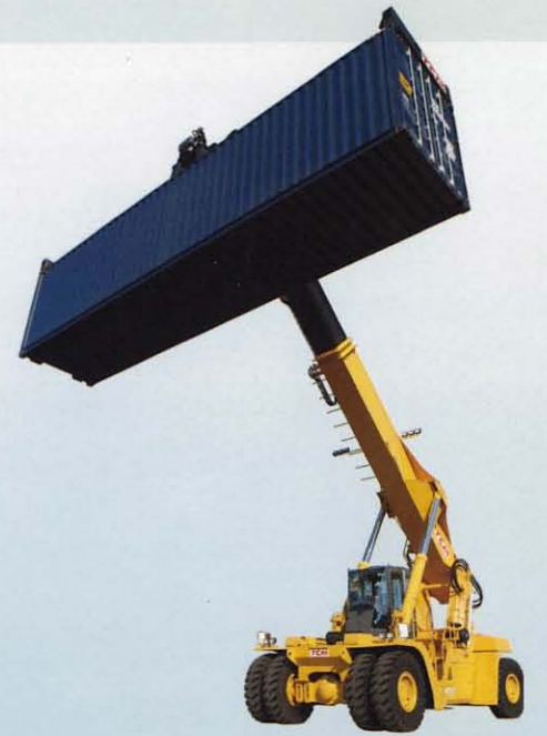
リーチスタッカー MR450