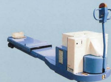
歩行式ポートキャリア