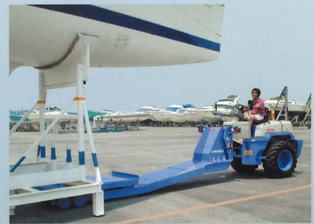
大型ポートキャリア TMD125/TMD300