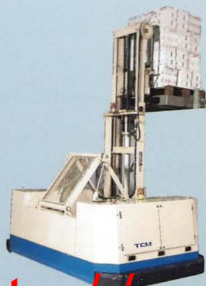
無人サイドフォークリフト