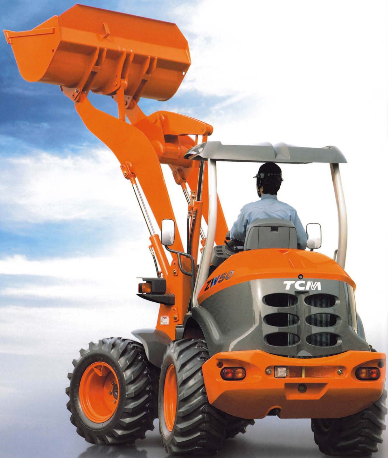
WHEEL LOADER ホイールローダ