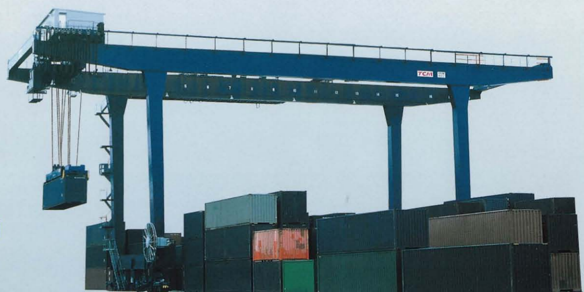
トランスファークレーン(レール式) RMG