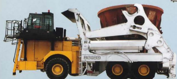
スラグダンプ DS15 / DS25 / DS35 / DS45 / DS50 / DS100