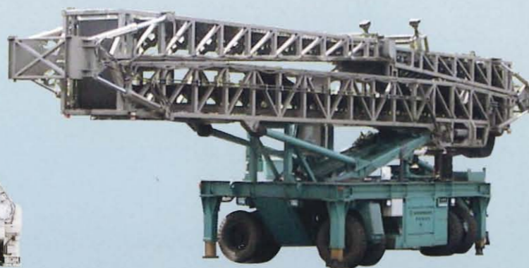
自走式ベルトコンベア TBL2 / TBL3 / TBL5 / TBL12