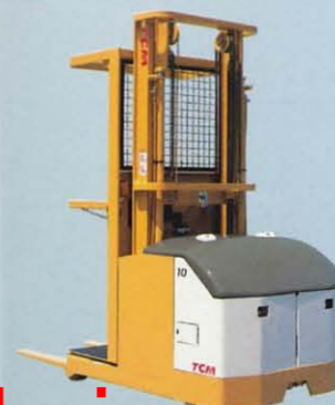
無人カウンタバランスフォーク