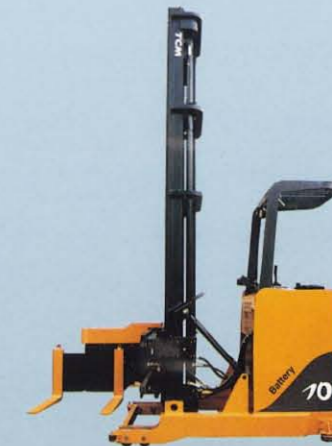
スリーウェイ スタッキングフォーク