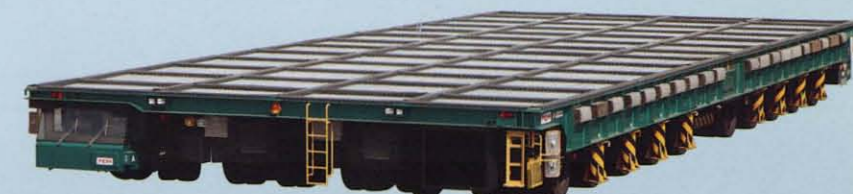
走行台車 P10 / P20 / P40 / P60 / P80 / P100 / P130 / P150 / P200 / P250 / P300 / P350 / P400 / P600 / P700 / P750 / P1000