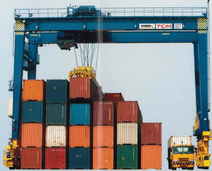
ハイブリッド式トランスファークレーン(タイヤ式) CT4H / CT5H / CT6H