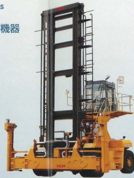
空コンテナ専用フォークリフト FC70H