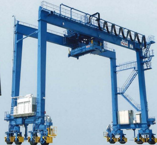
トランスファークレーン(タイヤ式) CT4 / CT5 / CT6