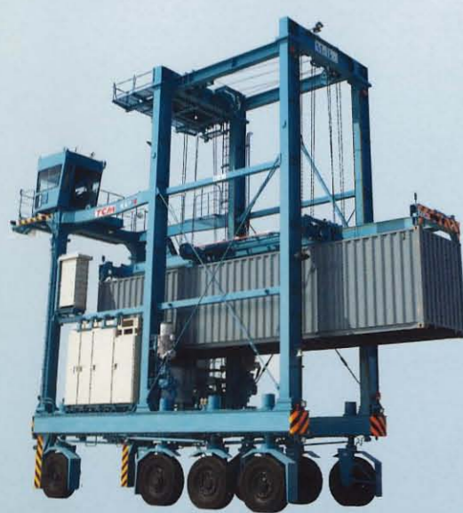
コンテナキャリア S3/S4/S4WE