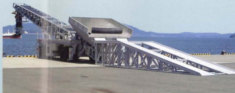
船積み用自走式ベルトコンベア TBL3S / TBL5S / TBL8S