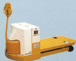
パレットトラック