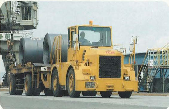
MT80(けん引力 8 t)