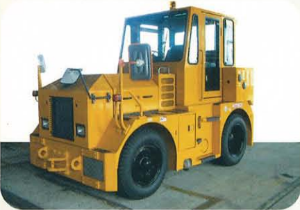
MT50(けん引力 5 t)