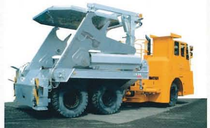
鍋転倒防止ガイド付き