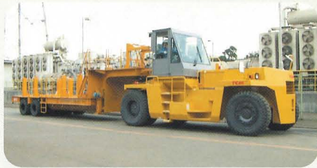
MT150(けん引力 15 t)