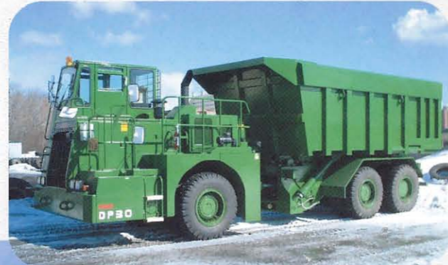
DP30(パレット非分離式)