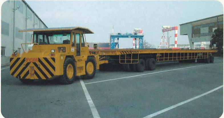
MT200(けん引力 20 t)