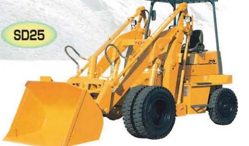
■スキッドステアローダ・ショベルローダ Line up