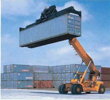
●リーチスタッカー MR420