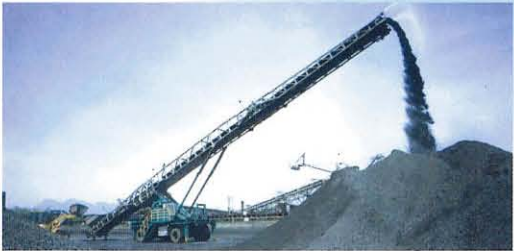
●自走式ベルトコンベア TB5W