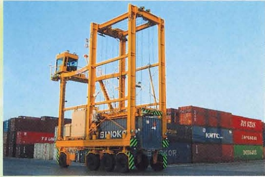
●コンテナキャリア S4W