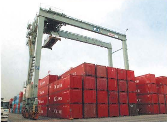
●タイヤ式トランスファークレーン CT5