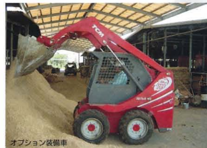
オプション装備車