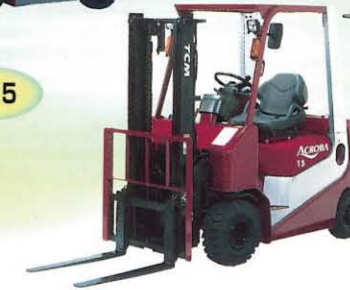
■アクロバ Line up