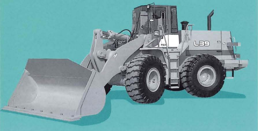
※写真の車両はオプション装備車です。(ワンタッチカブラ、ハイリフトアーム、など)