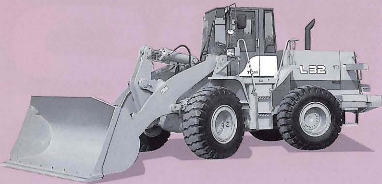
※写真の車両はオプション装備車です。(ワンタッチカブラ、ハイリフトアーム、など)