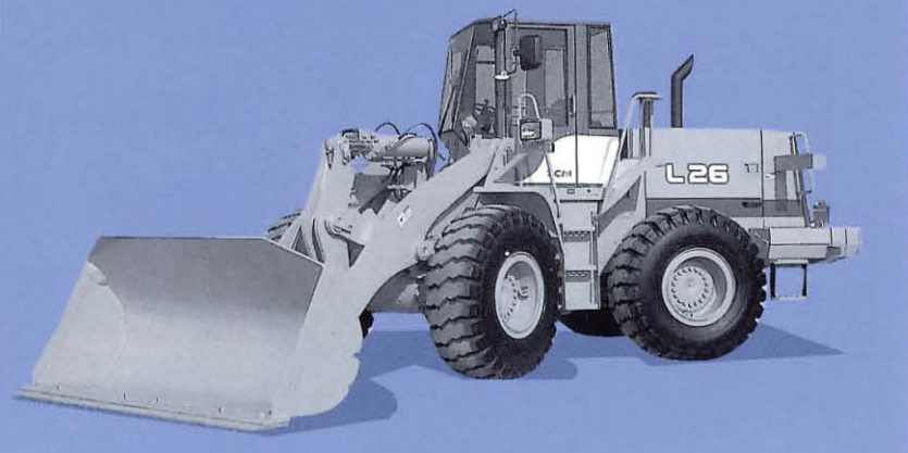
※写真の車両はオプション装備車です。(ワンタッチカプラ、ハイリフトアーム、など)